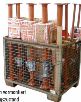
Aufbaugruppen vormontiert im Auslieferungszustand